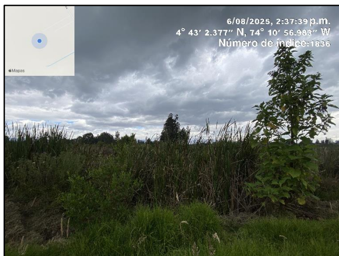
Ilustracion 2. Evidencia recorrido punto 1

Dentro del recorrido de control y vigilancia en el humedal Guali, no se evidenció presencia de residuos, motobombas, ni semovientes que puedan afectar al ecosistema, ni actividades que alteren el entorno natural o la calidad del agua (ver ilustraciones 2,3,4 y 5).