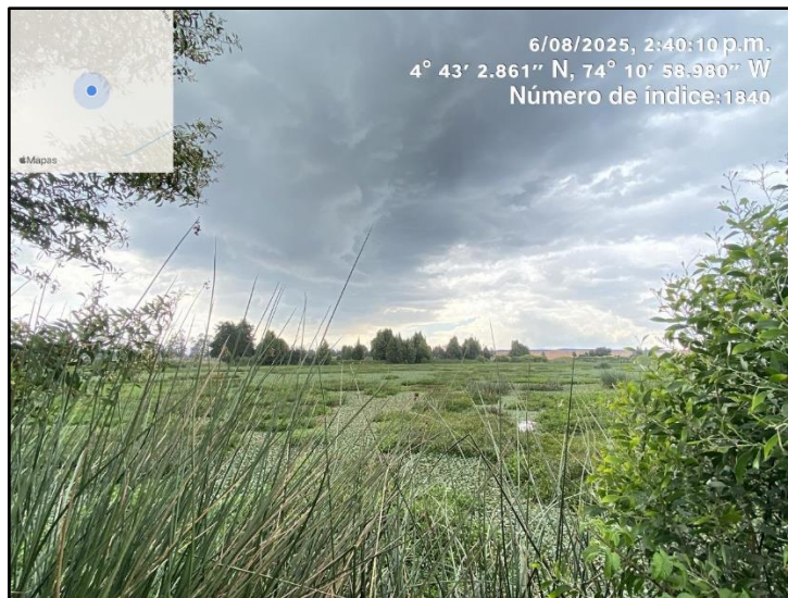
Ilustracion 5. Evidencia recorrido punto 4

C.P.250020 Tel. +57(1) 823 40 70 823 40 71 / 823 40 73 Fax. + 57(1) 825 76 20 Dir. Cra. 14 No. 13-05