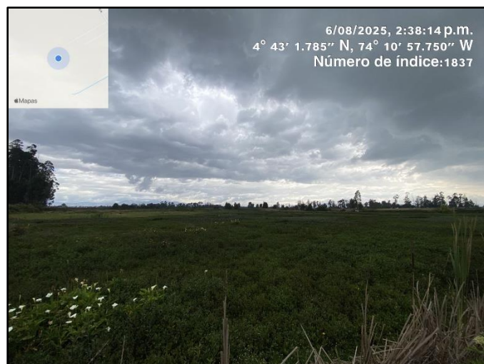
Ilustracion 3. Evidencia recorrido punto 2