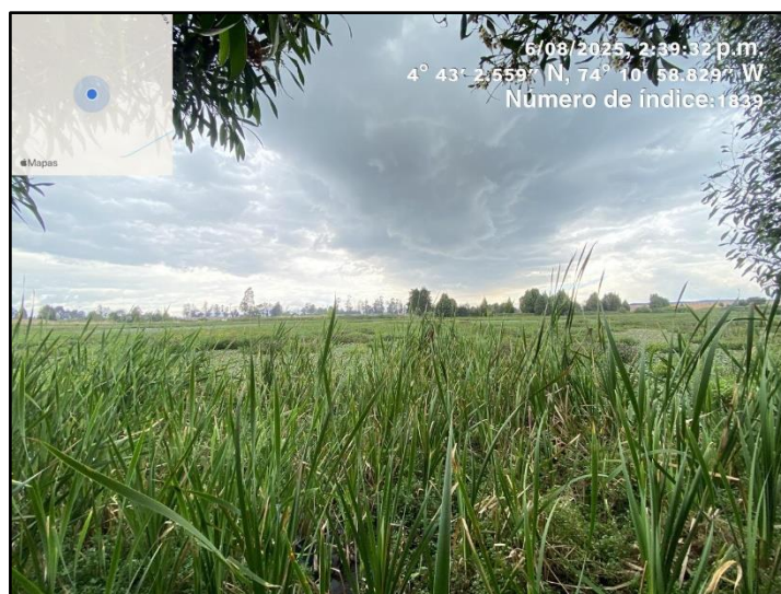
Ilustracion 4. Evidencia recorrido punto 3